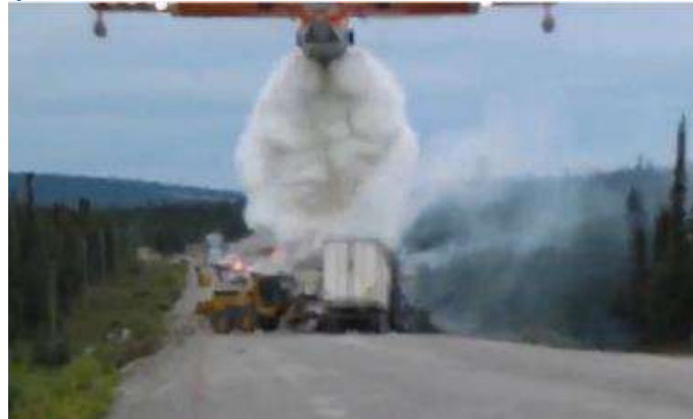
copie écran CNOTV

Les pompiers couvrant le territoire de l'autoroute Trans-Labrador dans le Nord Est du Canada, ont été confrontés à un dilemme lorsqu'ils ont été amenés à éteindre un feu de semi remorque contenant des produits inflammables survenu sur l'autoroute, il n'y avait pas de point d'eau à proximité...qu'à cela ne tienne, ils ont fait appel aux grands moyens en utilisant un "canadair" local pour éteindre le sinistre!