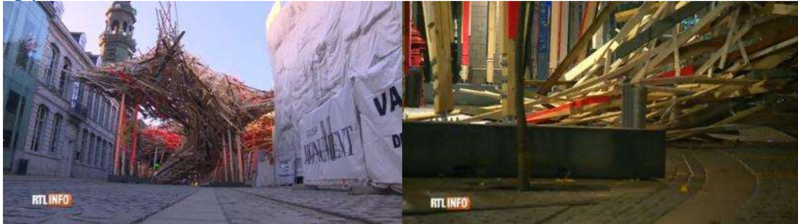
copie écran RTL infos

Une œuvre d'art s'est écroulée en grande partie dans la rue de Nimy, suite à "un problème lié à une poutre de mauvaise qualité qui a cédé et a entraîné la chute de plusieurs planches de la structure. Les conditions climatiques ne sont pour rien dans ce qui s'est passé". Toutes les mesures de sécurité ont été prises autour de l'œuvre effondrée. La réparation de l'œuvre d'art urbaine d'Arne Quinze "The Passenger", va être réalisée rapidement.