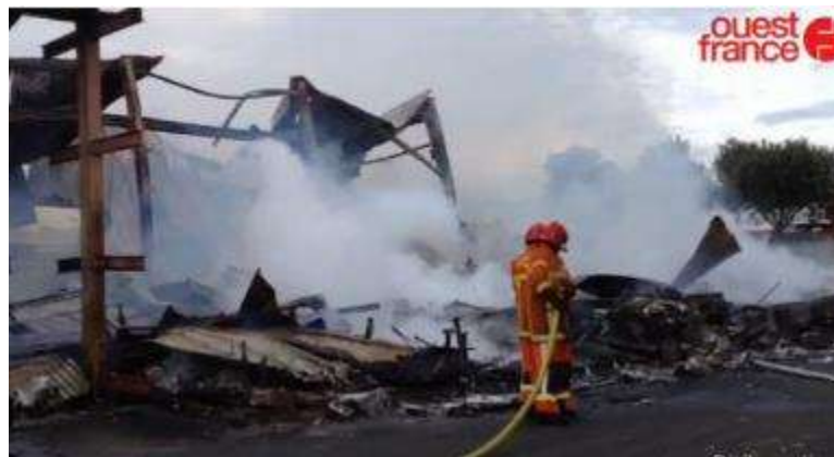
copie écran OF

Les 2 500 m 2 de locaux du constructeur de maison en bois Arcadial sont partis en fumée, vers 8 h, ce dimanche matin. L'incendie n'a pas fait de blessé mais le bâtiment est dévasté.. Des véhicules prêts déjà chargés pour intervenir sur les chantiers de construction de maisons en bois sont calcinés. D'après les premiers éléments d'enquête un court-circuit pourrait être à l'origine du sinistre. Les 58 employés de l'entreprise risquent de se retrouver au chômage technique.