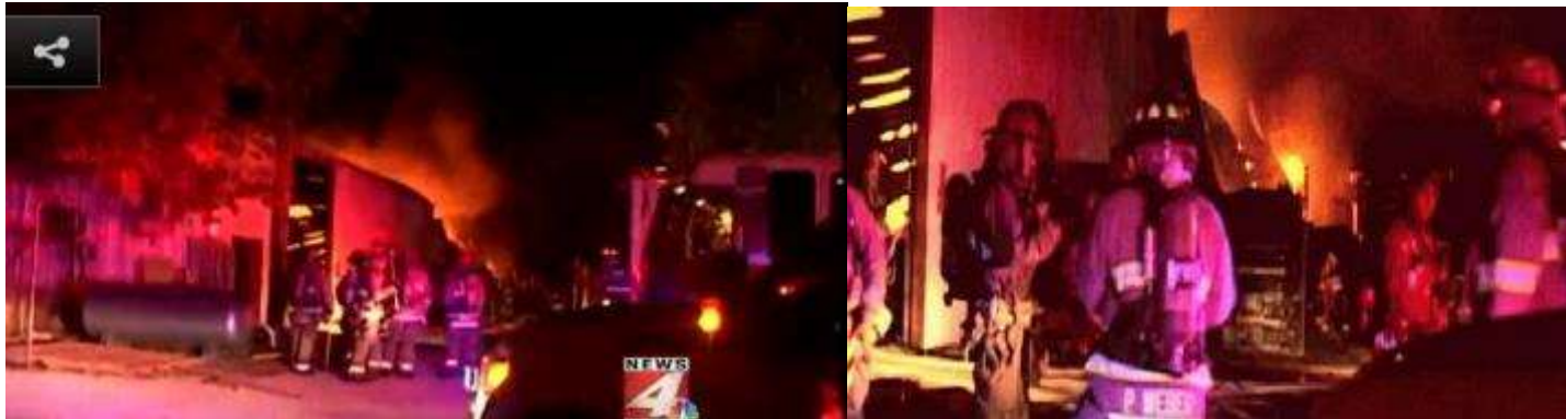
copies d'écran News4

Un incendie d'origine électrique a fait de très importants dégâts dans un entrepôt de matières plastiques de la société Franck Manufacturing à 00h49.