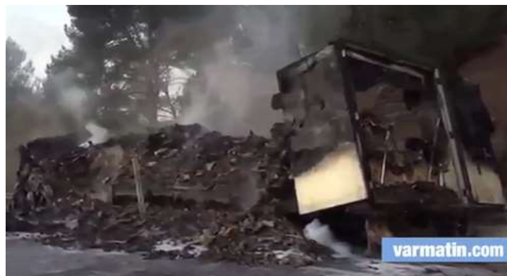
copie écran VM

Un poids-lourd transportant une cargaison de kiwis a pris feu sur l'autoroute A8 au niveau des Adrets en cours de matinée. L'incendie est dû à une surchauffe. Le routier a réussi à décrocher la cabine de sa cargaison qui a entièrement brûlé.