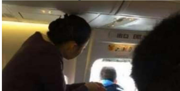
copie écran YT

C'est une scène pour le moins surréaliste qui s'est déroulée en Chine. Un homme qui embarquait pour un vol interne de Hangzhou vers Chengdu avait semble-t-il un peu chaud. Alors que l'avion s'apprêtait à décoller, il a ouvert une issue de secours et sorti sa tête, sous l'oeil stupéfait des autres passagers. Une hôtesse l'a alors retenu pour éviter un accident, visiblement choquée par ce geste incongru. "C'est la première fois que je vois ça" a-t-elle déclaré. Quand on lui a demandé ce qui lui était passé par la tête, il a répondu qu'il souhaitait "un peu d'air frais". C'était la première fois qu'il prenait l'avion, ce qui pourrait expliquer cette étrange réaction. Immobilisé le temps de remettre la porte de secours, l'avion est finalement parti, malgré un petit retard. La compagnie Xiamen n'a pas souhaité donner suite, assurant que cet incident n'avait pas causé de perte financière ou de retard important.