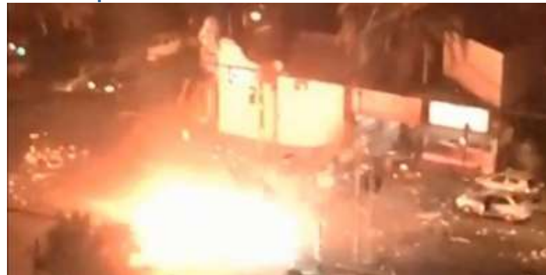
capture écran YT

Un peu avant 5h du matin, une voiture de police est heurtée par un autre véhicule, conduit par un homme en état d'ébriété. Un hélicoptère de la police locale se pose ensuite sur la route, tout près du lieu de l'accident. Puis un camion de pompiers arrive sur place. Le véhicule de secours, qui marque d'abord un temps d'arrêt, passe à côté de l'hélicoptère, mais heurte l'une de ses pâles et l'engin, toujours, au sol, commence à tourner sur lui-même avant d'exploser. Le pilote de l'hélicoptère, à son poste au moment de la collision, a été hospitalisé dans un état grave, tandis que les deux policiers à bord de la première voiture accidentée et le conducteur ivre étaient eux aussi blessés. Une enquête a été ouverte pour déterminer comment cet incident a pu se produire. Les pompiers ont assuré avoir reçu le feu vert de la police pour s'approcher du lieu de l'accident.